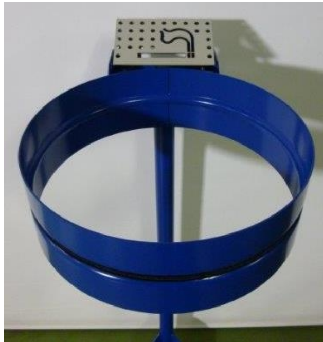
Abb. Artikelnr: 5941