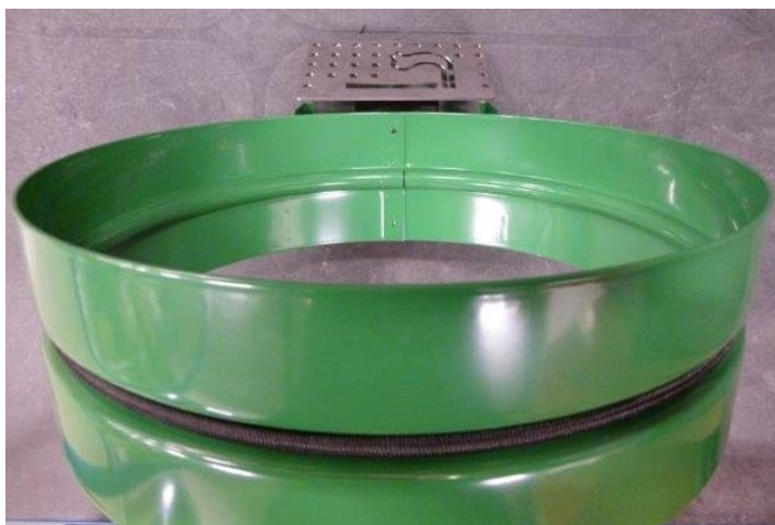
Abb. Artikelnr: 5941