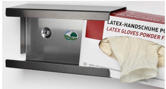
N° d'art.: 5920 Simple, ouvert