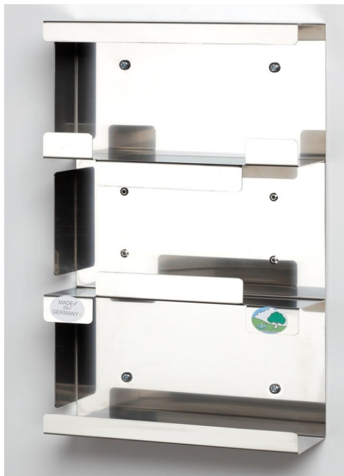
N° d'art.: 5921 Triple, ouvert