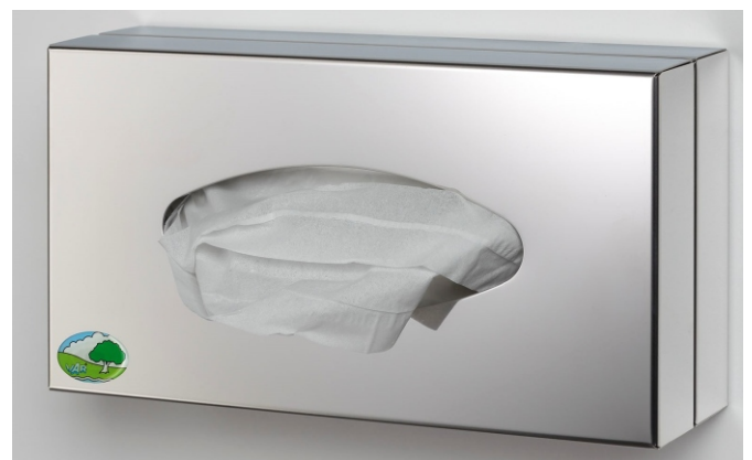
N° d'art.: 5922