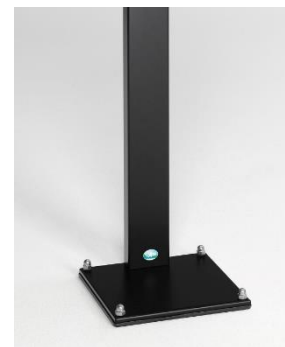
Abb. Artikelnr. 12059