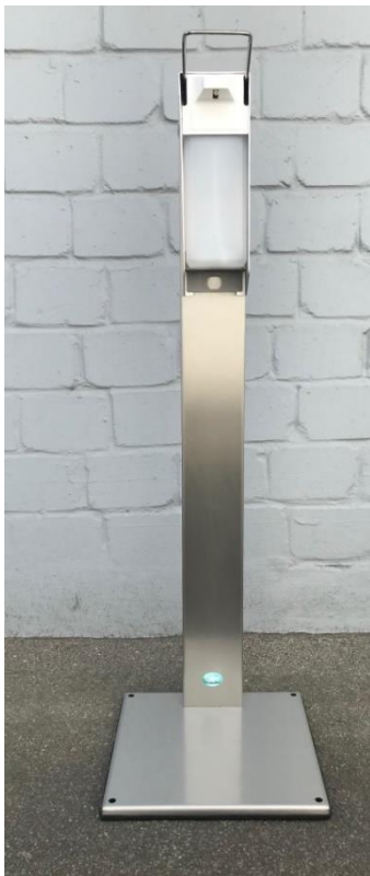
Abb. HDS 41, Edelstahl, Artikelnr. 2070 + Standfuß, Artikelnr. 12059