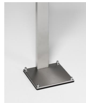
Abb. Artikelnr. 12081