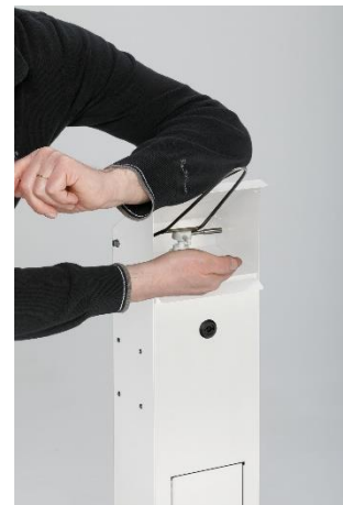
Abb. Bedienung des Handdesinfektionsspenders