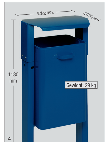
Abb.: Art.-Nr. 16540