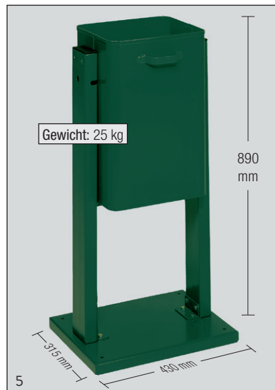
Abb.: Art.-Nr. 16552

Gefertigt werden die Außengeräte Typ AG 08 aus Stahlteilen. Als optimaler Oberflächenschutz – für den Außen-einsatz – sind die Geräte komplett feuerverzinkt oder verzinkt und pulverbeschichtet. Die Behälter haben einen Inhalt von ca. 40 l. Ausgerüstet sind die Geräte mit einem Dreikant-Schloss. Ein Dreikanthohlschlüssel sowie das benötigte Montagematerial (Aufdübeln bzw. Wand- oder Rohrbefestigung) gehören zum Lieferumfang.