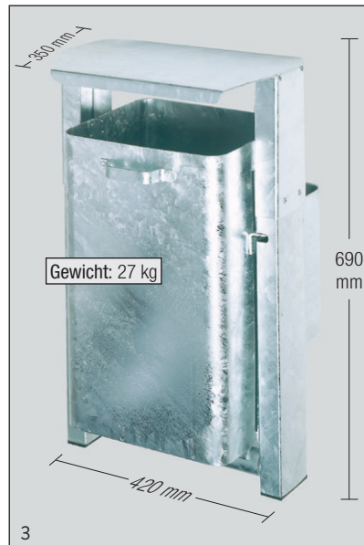
Abb.: Art.-Nr. 16521