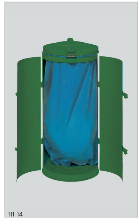
Abb.: Mit Doppelflügeltür. Einfaches Wechseln des Abfallsackes.

Als Zubehör wird ein Satz Halterungen (Art.-Nr. 1085) angeboten. Diese „Halter“ werden einbetoniert und können mit dem Boden des Kompakt-Doppeltür-Luxus verbunden werden. Eine absolute Standfestigkeit ist somit gewährleistet.