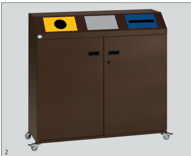
Abb.: Art.-Nr. 21212 und Art.-Nr. 21209